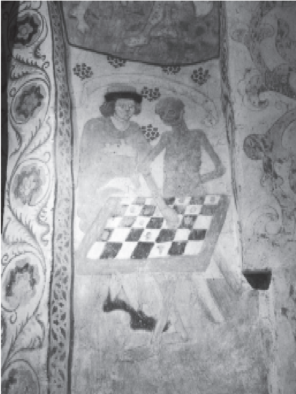
Abb. 2: „Tod spielt Schach“, Albertus Pictor (Wandmalerei, Täby-Kirche, Schweden, um 1480)