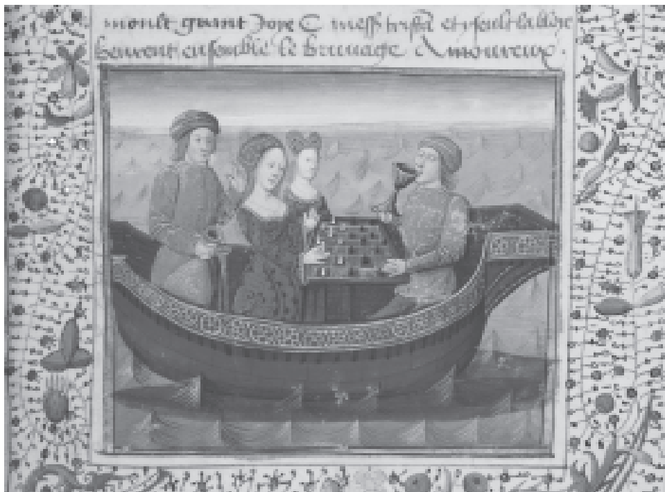
Abb. 3: „Tristan und Iseult mit Schachspiel und Liebestrank“, Buchmalerei aus Tristan de Léonois , 1470

Auch hier ist es durchaus kein Zufall, dass die beiden Liebenden mit einem Schachspiel zu sehen sind. Das Spiel ist keine Dekoration, sondern hat in der mittelalterli-